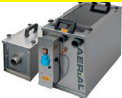
VDT 1000 Hepa-Filter H13