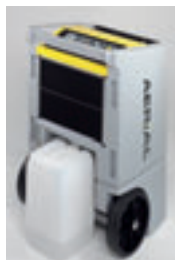
Externer Wasserbehälter mit 25 l bei AD 770/790

Alle wichtigen Anbauteile sind leicht zu demontieren und ermöglichen somit einen absolut schnellen Zugang für Service- und Reinigungszwecke.