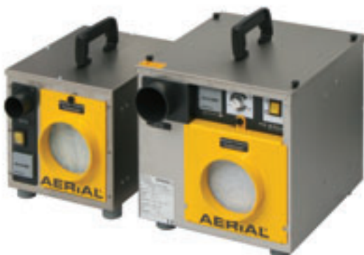
ASE 200 · ASE 300