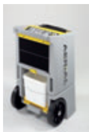
Integrierter Wasserbehälter bei AD 740/750