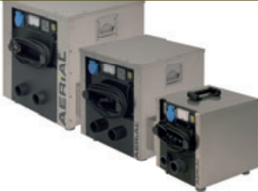
AB 200 · AB 500 · AB 1000 · Drybox ·