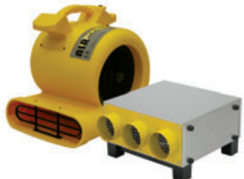
AirMaxx 3600, AirMaxx 2000