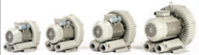
Seitenkanalverdichter Typ BH